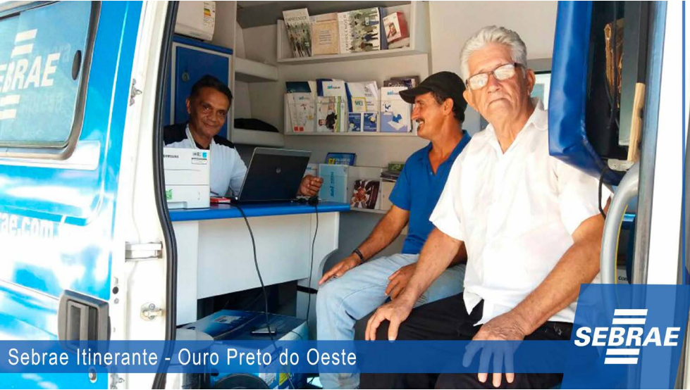
Sebrae Itinerante - Ouro Preto do Oeste