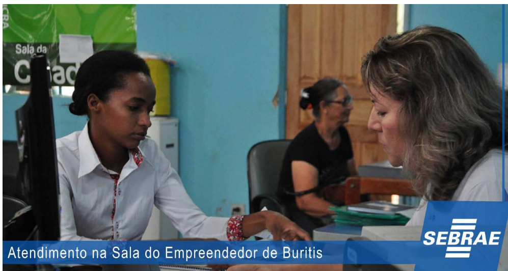
Atendimento na Sala do Empreendedor de Buritit