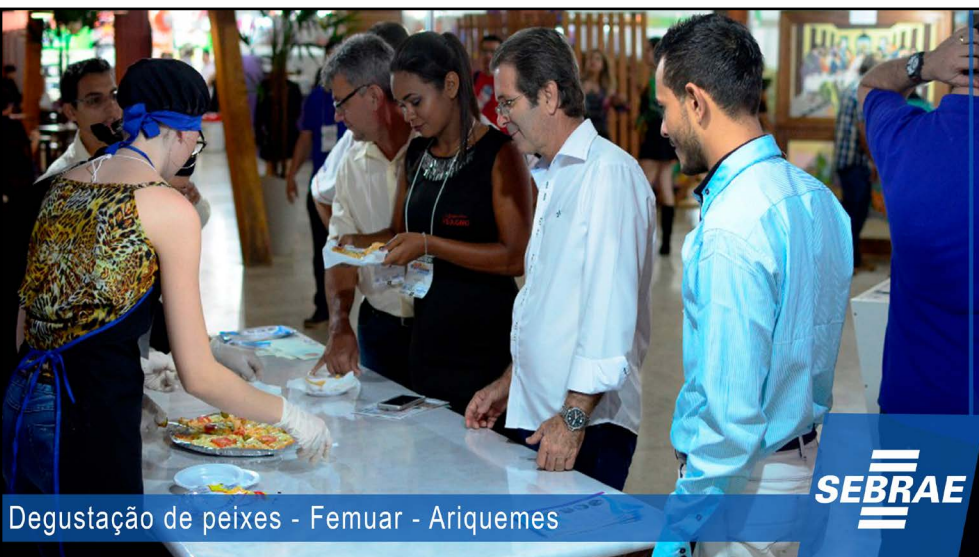
Degustação de peixes - Femuar - Ariquemes