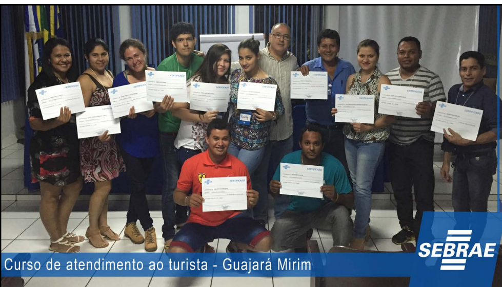
Curso de atendimento ao turista - Guajará Mirim