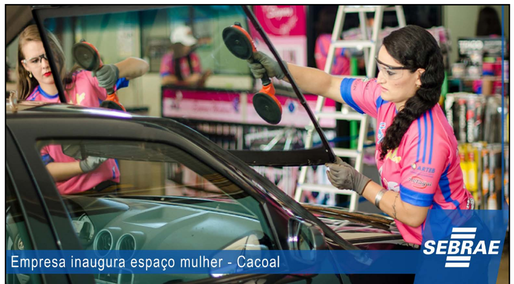
Empresa inaugura espaço mulher - Cacoal