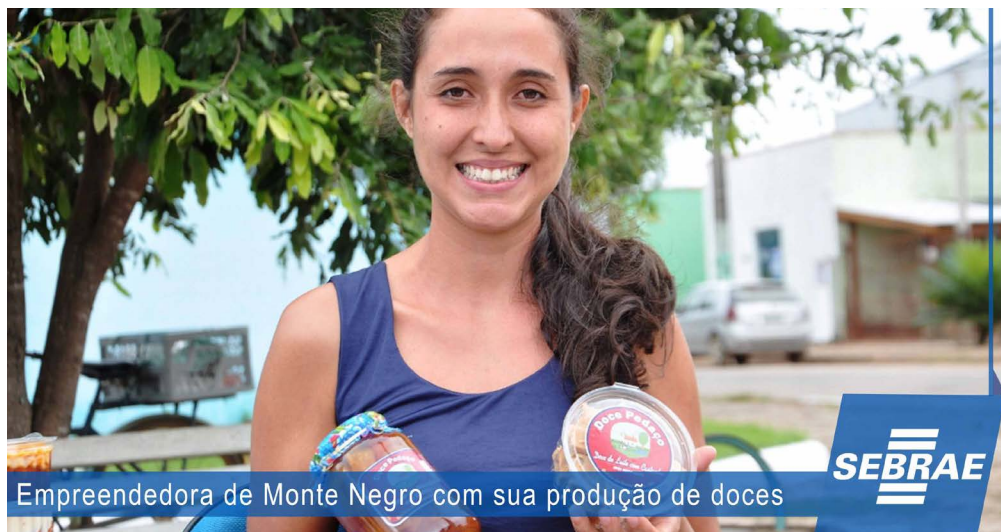
Empreendedora de Monte Negro com sua produção de doces