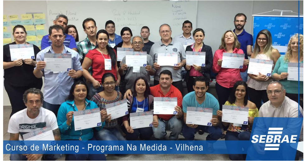
Curso de Marketing - Programa Na Medida - Vilhena