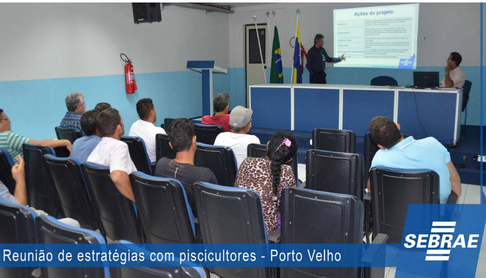
Reunião de estratégias com piscicultores - Porto Velho