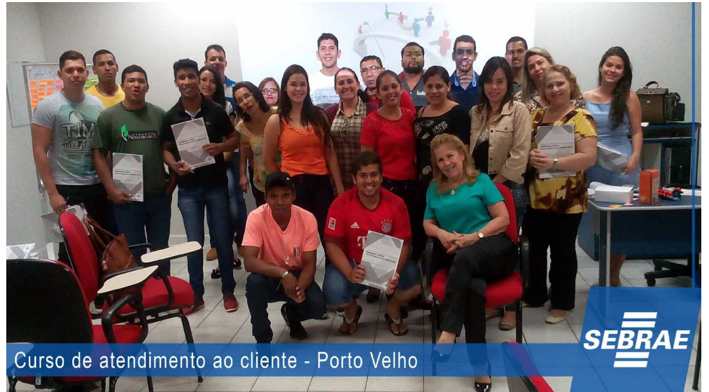
Curso de atendimento ao cliente - Porto Velho