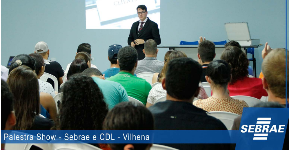
Palestra Show - Sebrae e CDL - Vilhena