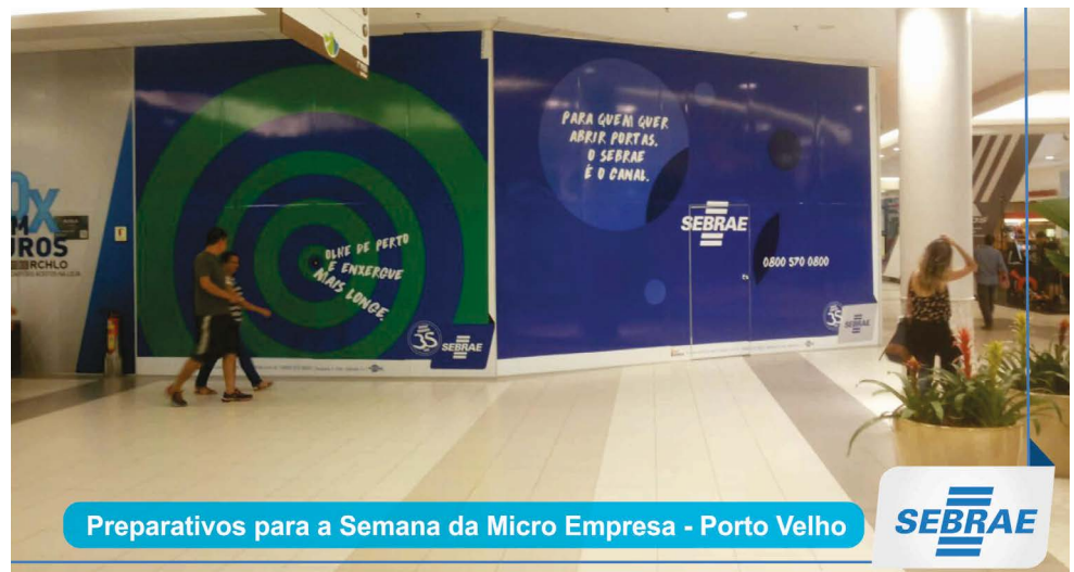
Preparativos para a Semana da Micro Empresa - Porto Velho