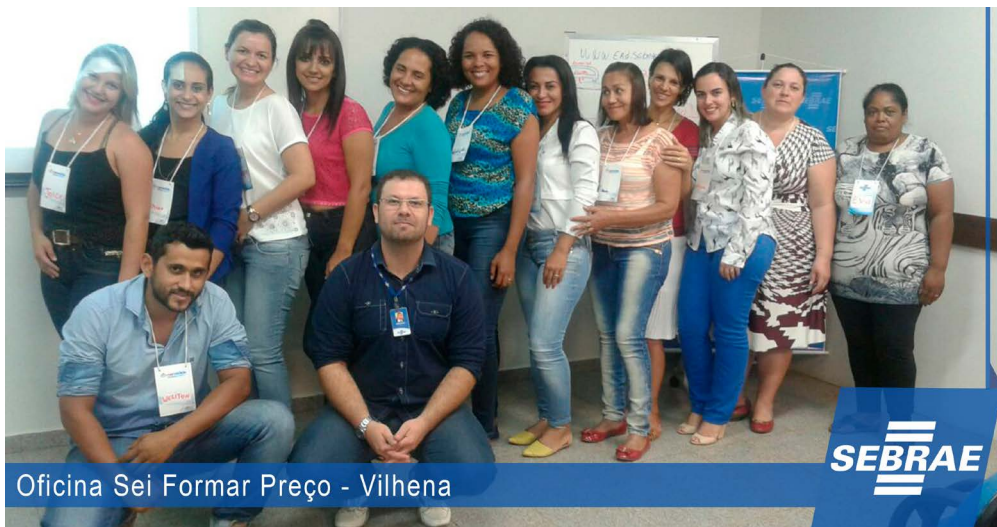
Oficina Sei Formar Preço - Vilhena