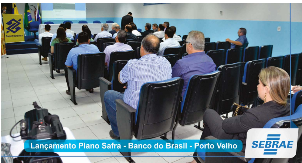
Lançamento Plano Safra - Banco do Brasil - Porto Velho