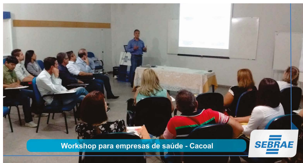
Workshop para empresas de saúde - Cacoal