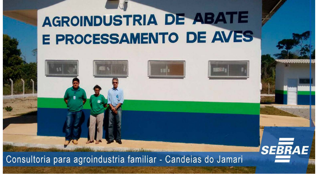
Consultoria para agroindustria familiar - Candeias do Jamari