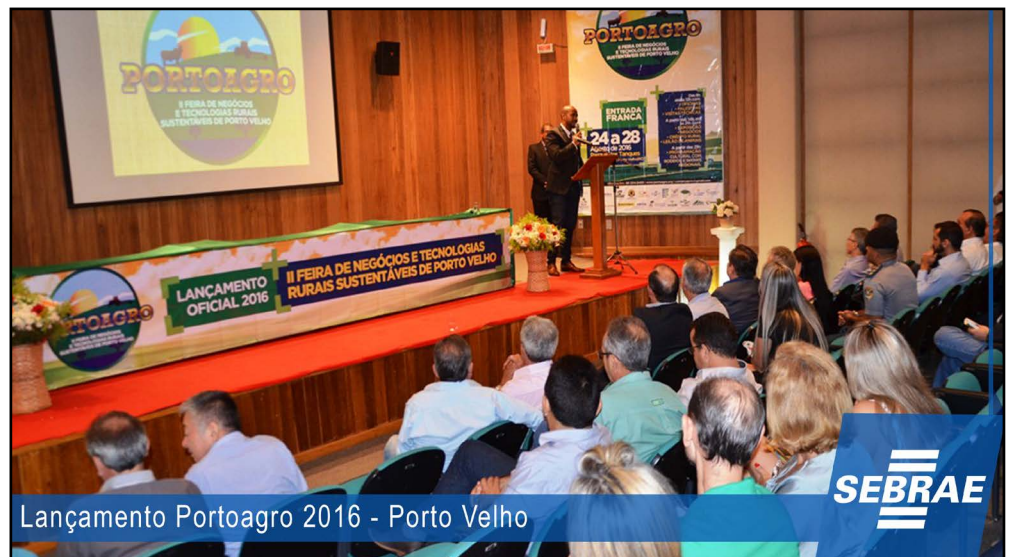
Lançamento Portoagro 2016 - Porto Velho